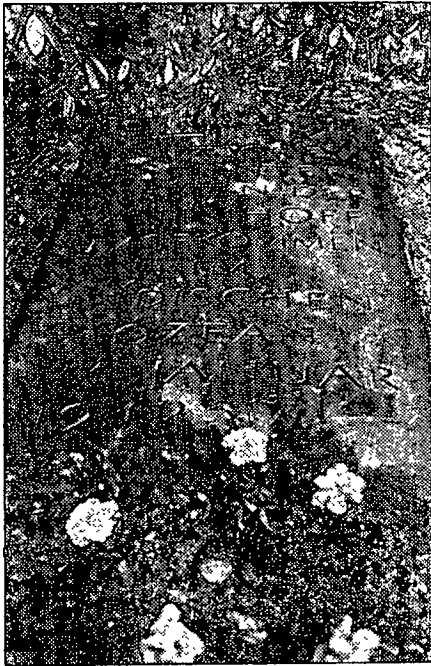
Gedenkstein für „van Imhoff“-Opfer* Rettungsboote blieben leer

In Ihrem Artikel, zu dem ja noch vieles gesagt werden könnte, fehlt meiner